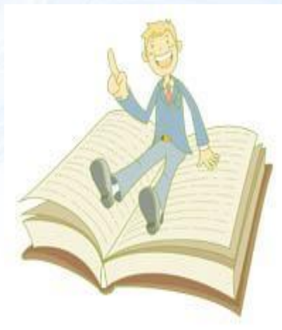
Таблица умножения достойна уважения?