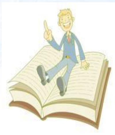
Таблица умножения достойна уважения?