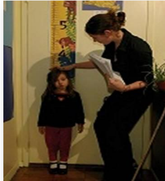
Визначення росту та ваги дитини