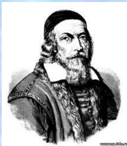
Ян Амос Каменский

«Считай несчастным тот день или тот час, в котором ты не усвоил ничего, ничего не прибавил к своему образованию»