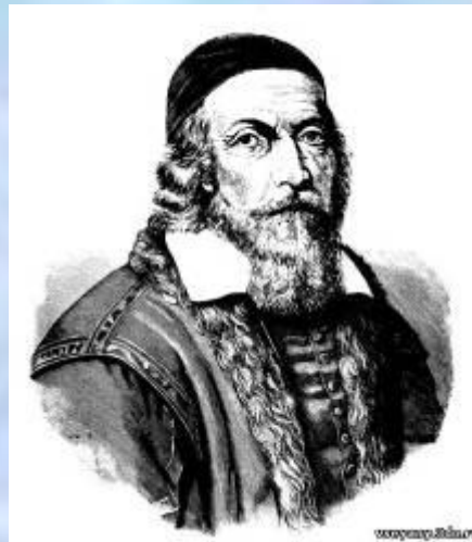
Ян Амос Каменский

«Считай несчастным тот день или тот час, в котором ты не усвоил ничего, ничего не прибавил к своему образованию»