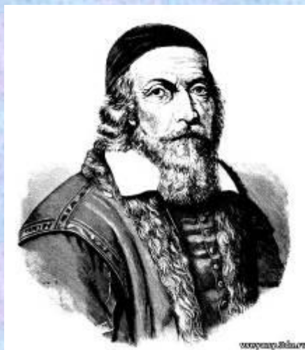
Ян Амос Каменский

«Считай несчастным тот день или тот час, в котором ты не усвоил ничего, ничего не прибавил к своему образованию»