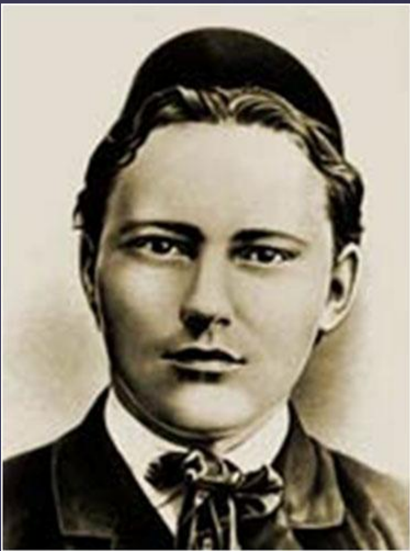
Габдулла Тукай татар халык шагыйре