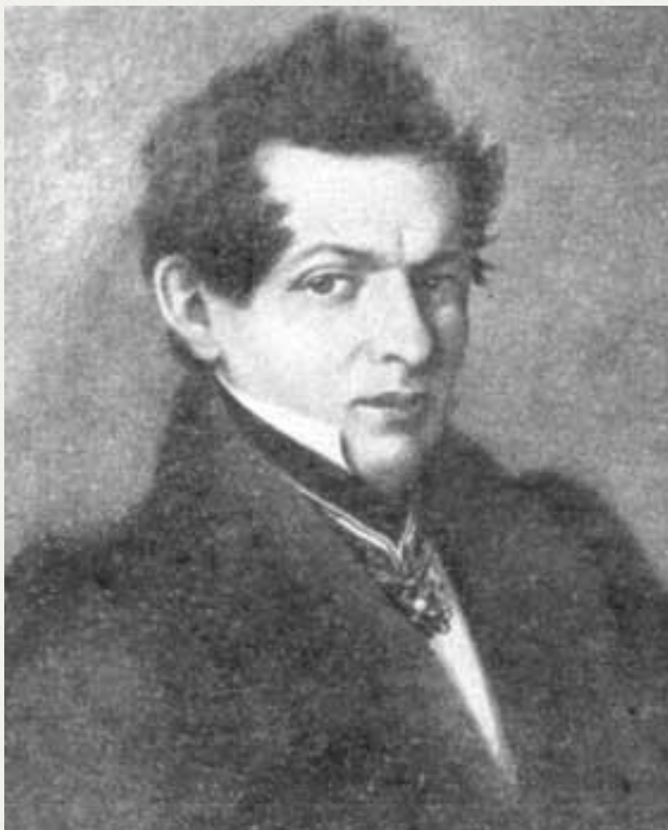
Н.И. Лобачевский (1792 - 1856) - атактуу, орус математиги