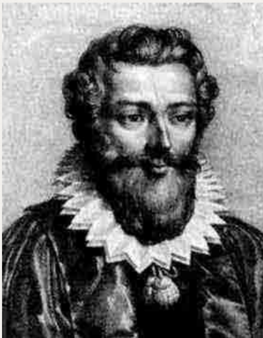
Франсуа Виет (1540-1603) - француз математики, юрист