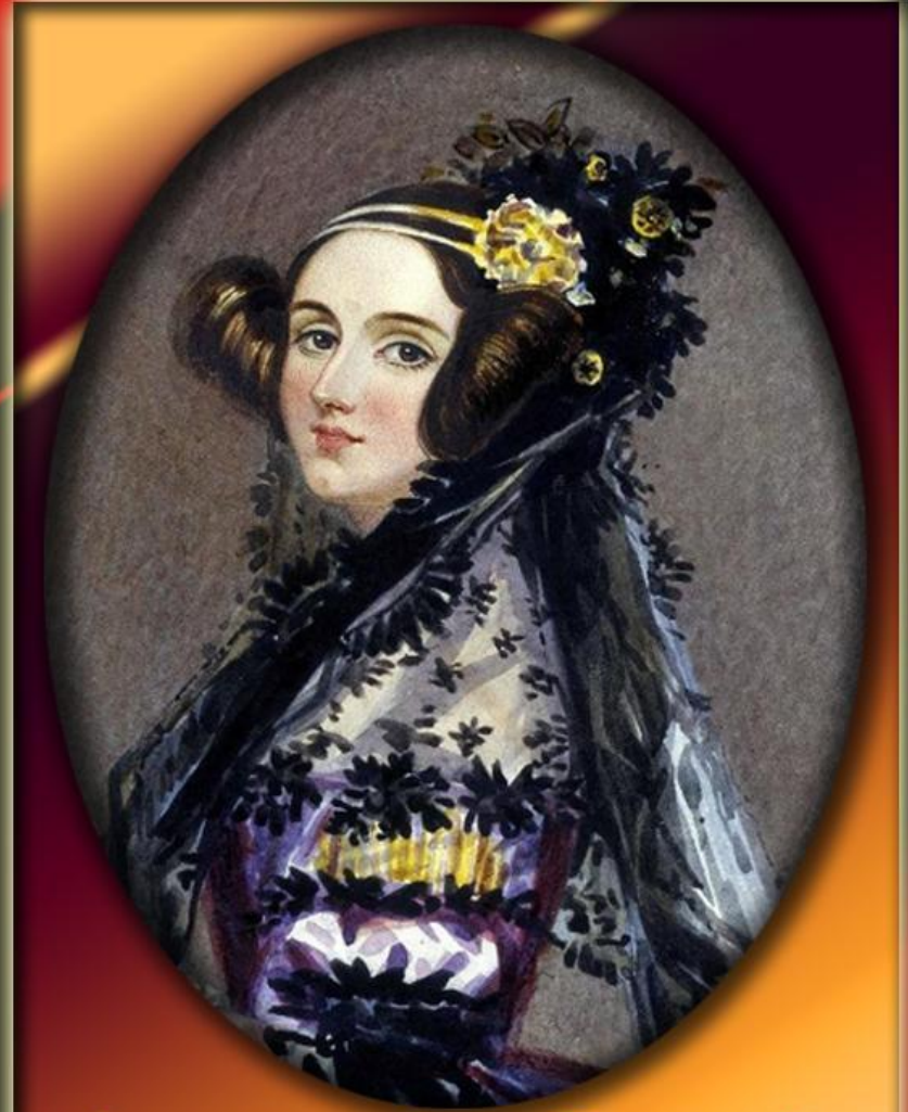
Августа Ада Лавлейс 10.12.1815-27.11.1852