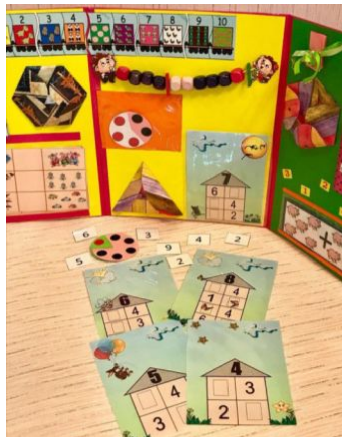
Дидактические игры: «Числовые домики», «Веселый счет»