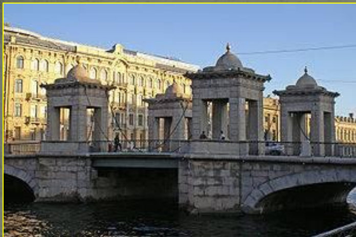
Мост Ломоносова через Фонтанку. Санкт-Петербург