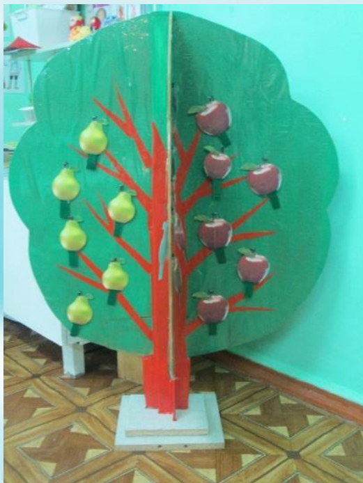
Воспитатель старшей группы №6 Белюсова Э.М.