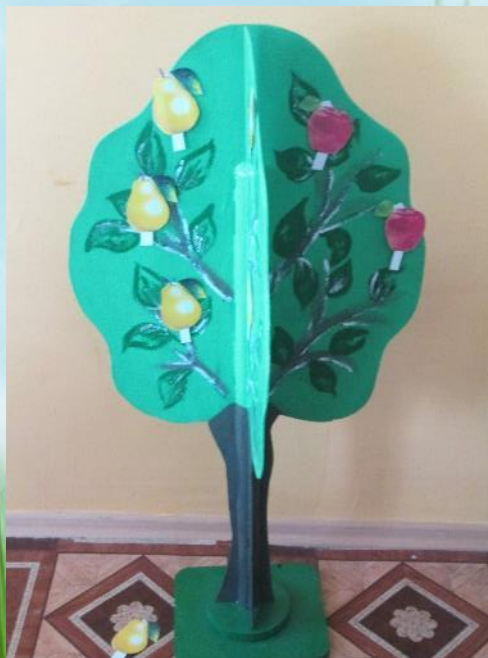
Воспитатель старшей группы №7 Гишварова А.А.