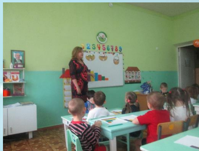
«Путешествие в стану математики»