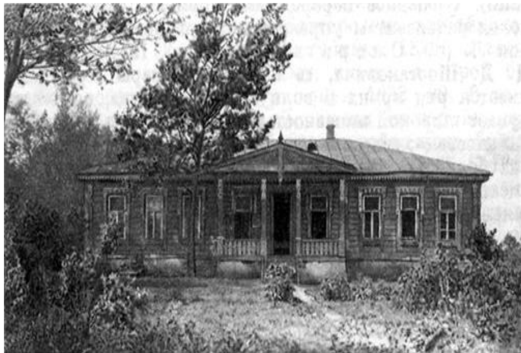
Кропотово. Имение Ю. П. Лермонтова. Фотография 1937.