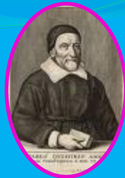
Папп ( III в. н. э. )