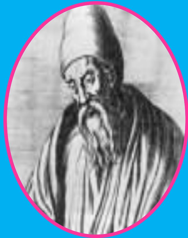
ЕВКЛИД (в III в. до н. э.)

« Параллельные суть прямые, которые, находясь в одной плоскости и будучи продолжены в обе стороны неограниченно, ни с той, ни с другой стороны между собой не встречаются.»