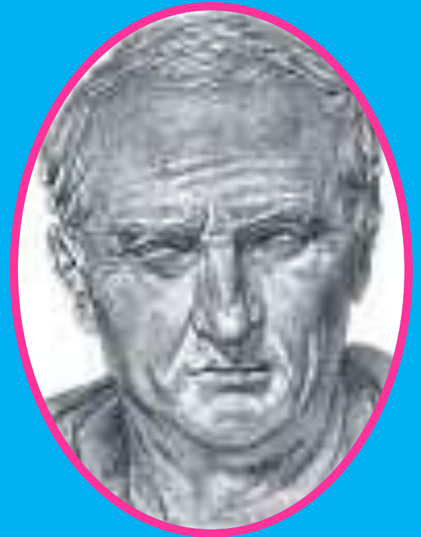
Посидоний (I в. до н.э.)

«Две прямые, лежащие в одной плоскости и равностоящие друг от друга.»