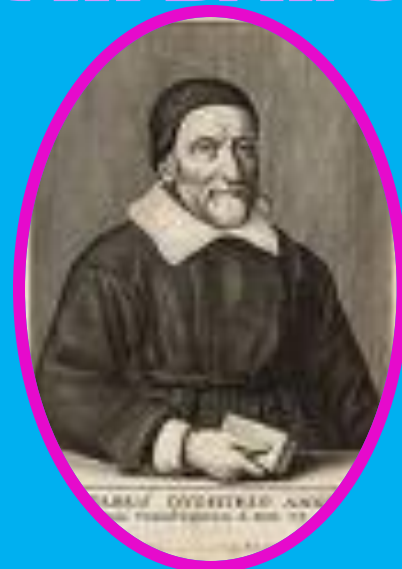
У. Оутред ( 1575-1660 )