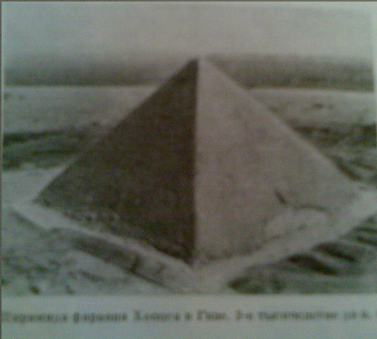
Гигантская пирамида Хеопса в Гизе.