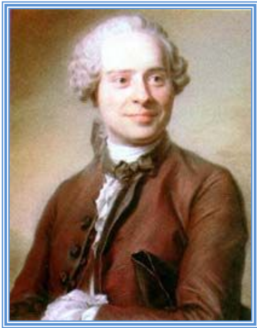
Жан Лерон Даламбер (1717 -1783)

Великий французский философ и математик Даламбер вошел в историю теории вероятностей со своей знаменитой ошибкой, суть которой в том, что он неверно определил равновозможность исходов в опыте всего с двумя монетами!