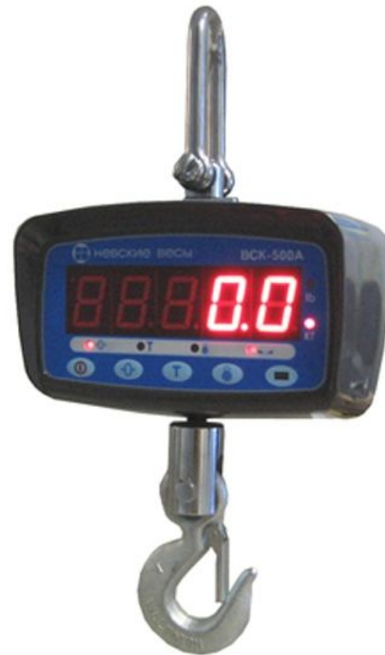
Крановые электронные весы