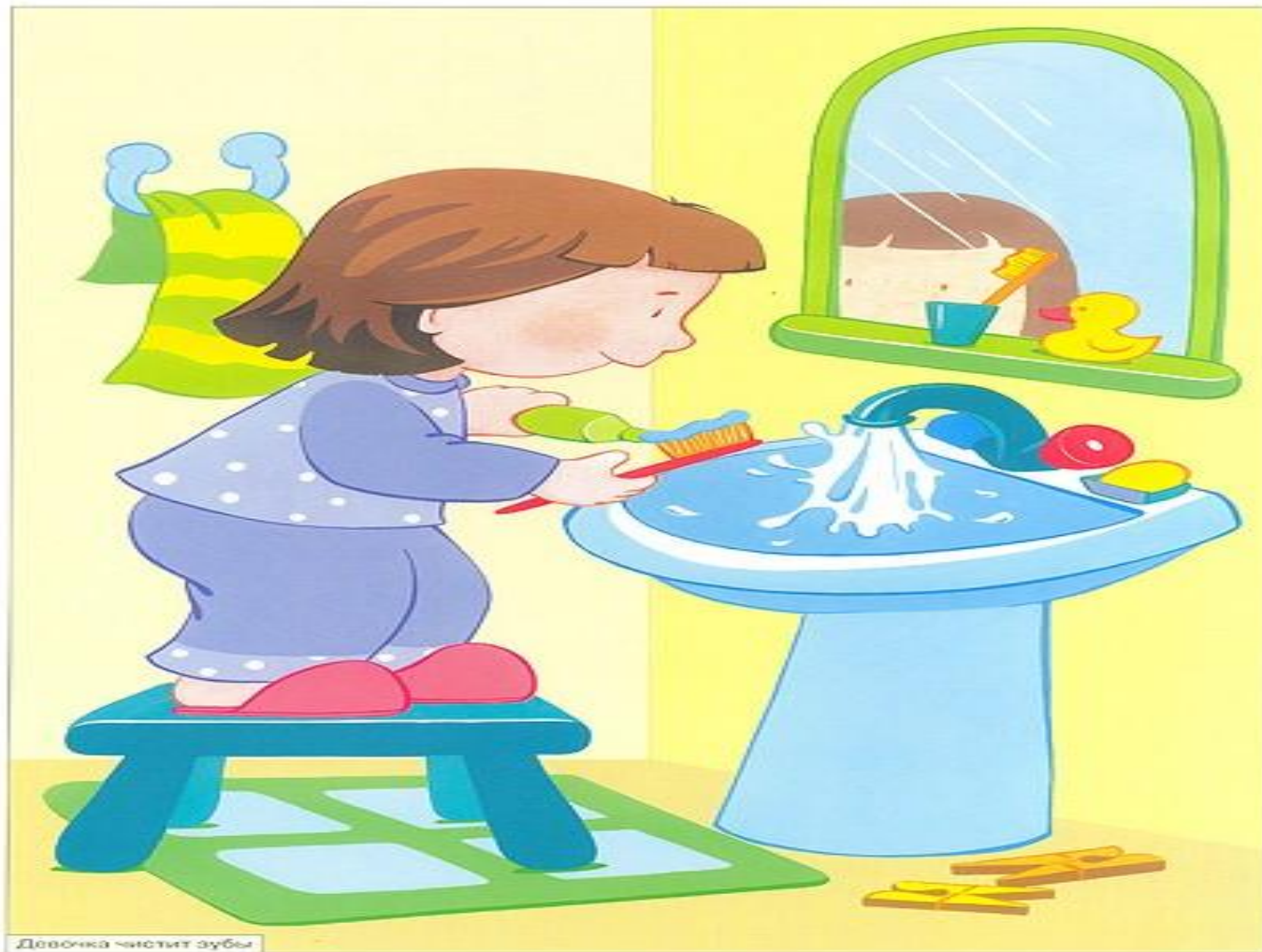
Девочка чистит зубы

Да здравствует мыло душистое и полотенце пушистое.