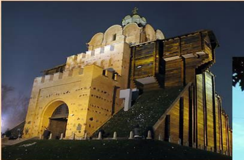
Главный вход в город XI века