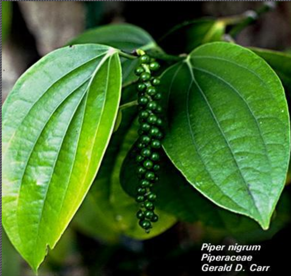
Piper nigrum Piperaceae Gerald D. Carr

А вот так растет черный перец на южных побережьях Индии