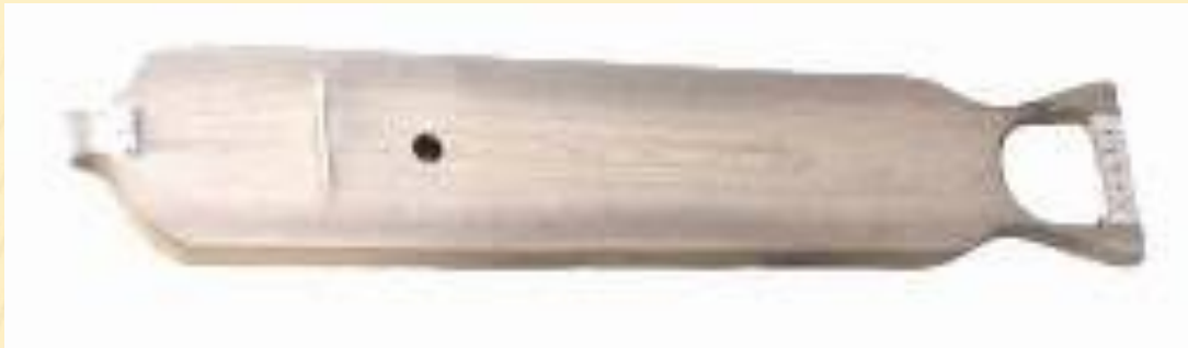
Санквылтап мансийский музыкальный инструмент