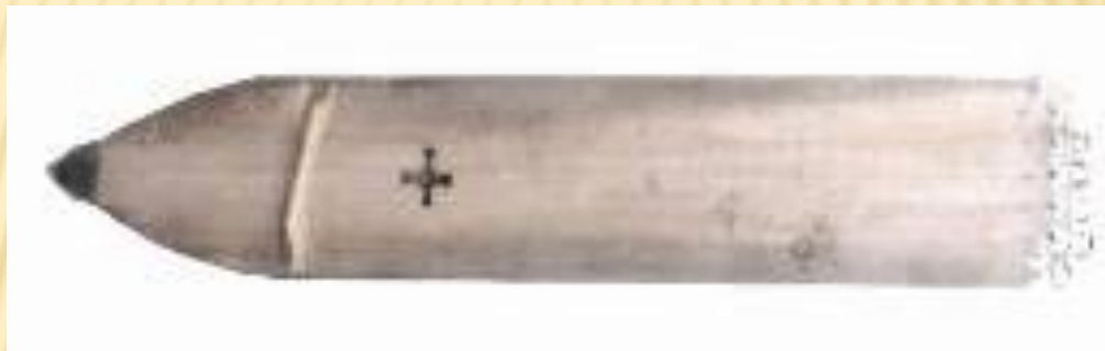
Нарсьюх хантыйский музыкальный инструмент