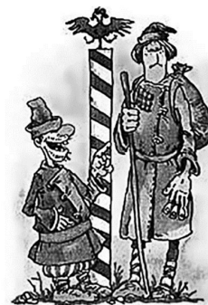
Коломенская верста - долгоязыый, высокий

На версту отстанешь - на десять догоняешь - даже небольшое отставание очень трудно преодолевать.