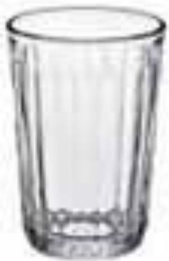
стакан гранёный банка