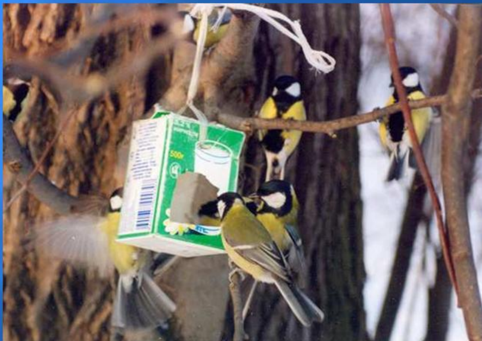
Перед стайкою синиц.