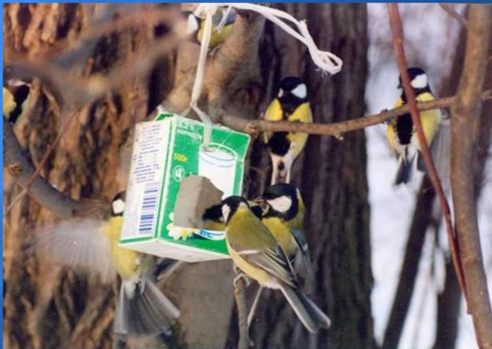
Перед стайкою синиц.