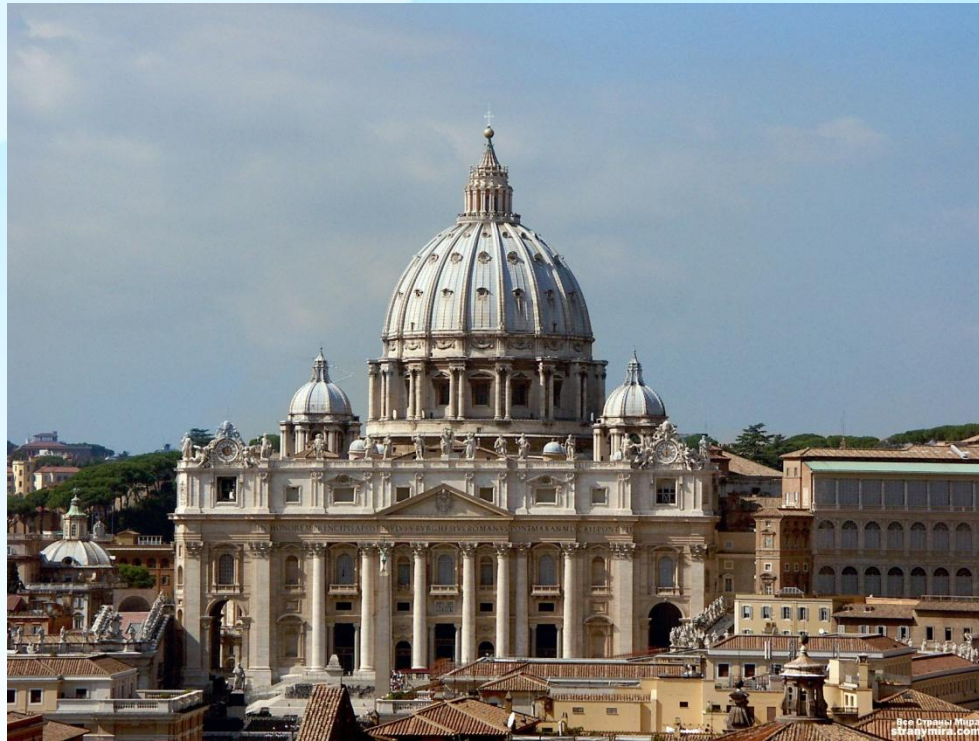
Собор Святого Петра(138 м)