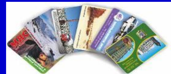
Карманный календарь (70x100 мм)