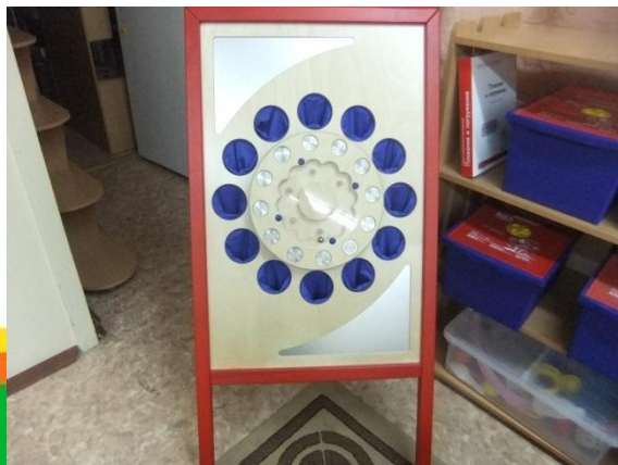
Развивающая игра «Сенсино»

блоки Дьенеша и карточки-схемы к ним, индивидуальные рабочие листы в клеточку, маркеры.