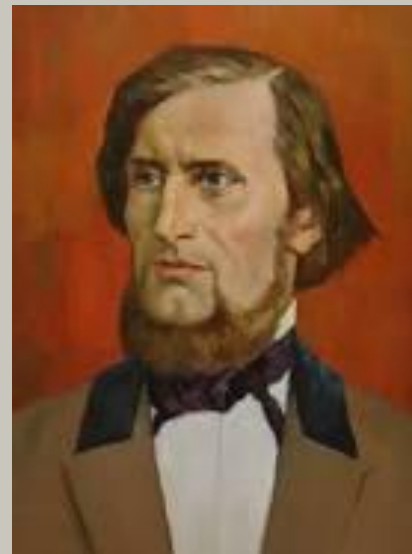
Константин Дмитриевич Ушинский