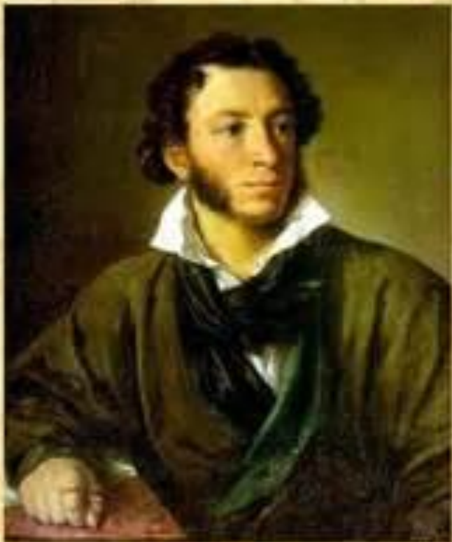
Александр Сергеевич Пушкин