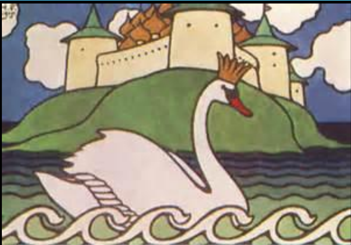
Е.В.Евсеев, Концовки "Сказки о царе Салтанте" А.С.Пушкина, 1905 г.