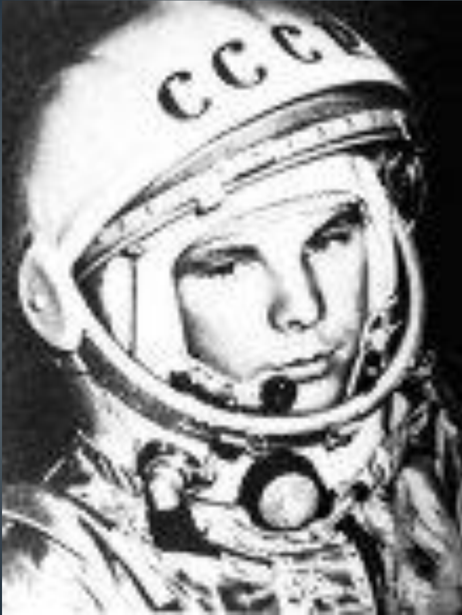
Юрий Алексеевич Гагарин