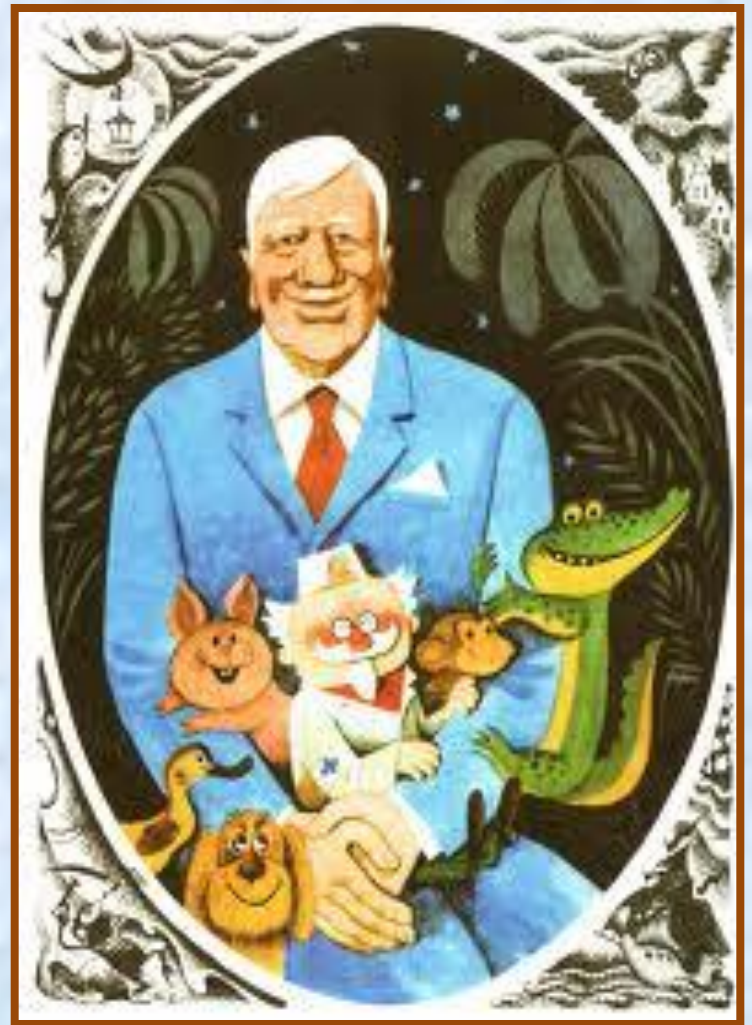
Корней Иванович Чуковский