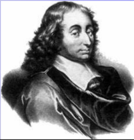
БЛЕЗ ПАСКАЛЬ 1623-62