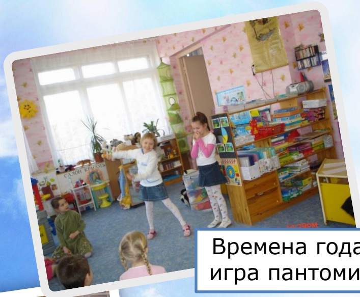
Времена года – игра пантомима