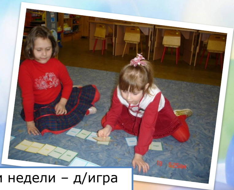
Дни недели – д/игра «Расставь по порядку»