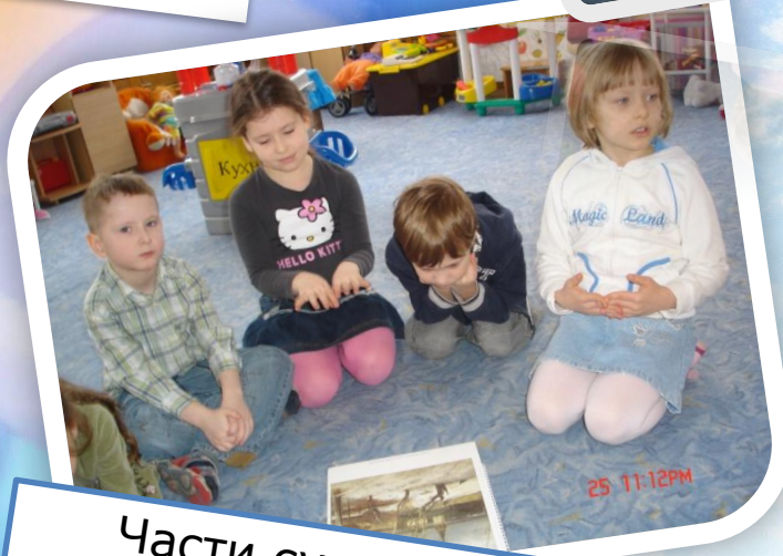
Части суток – обсуждение иллюстраций