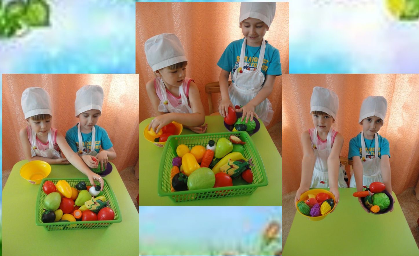
Игровое упражнение «Подготовим овощи для салата»