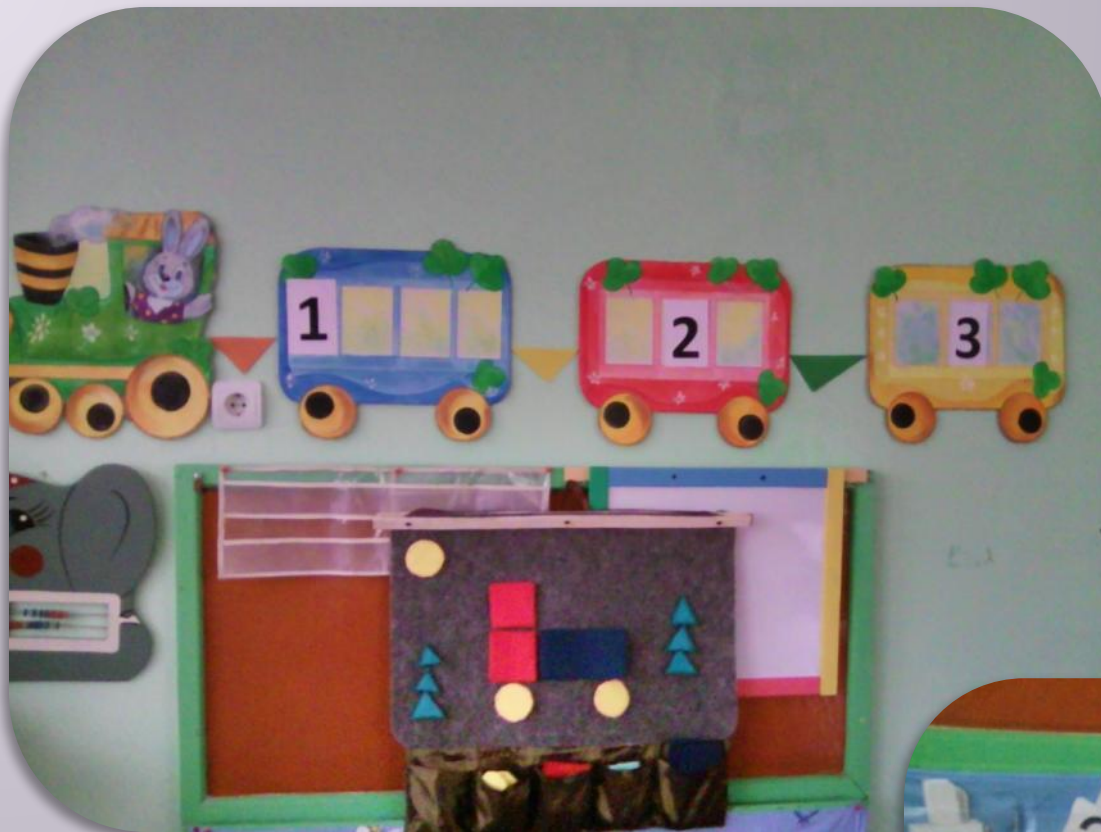
Геометрическое панно Числовой поезд