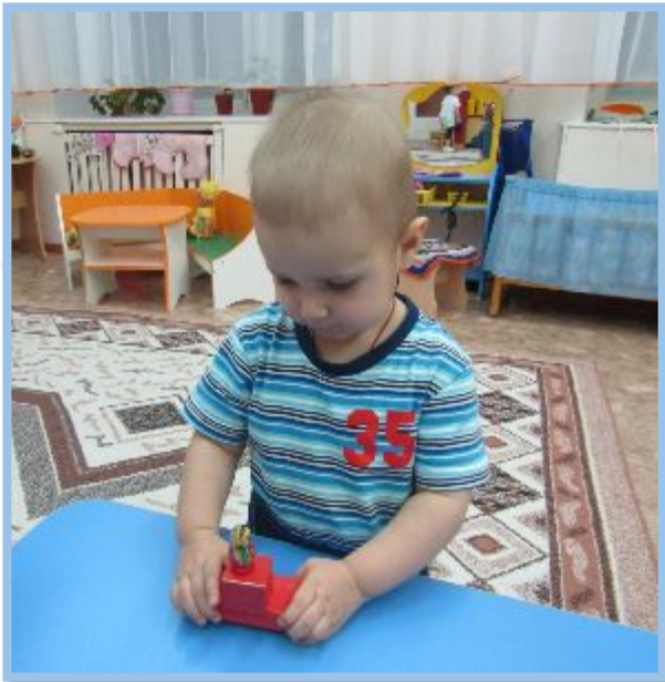
«Строим автомобиль для матрешки»