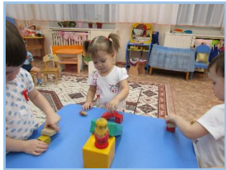
«Строим горку для матрешки»