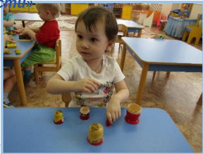
«Сколько матрешек пришло в гости»