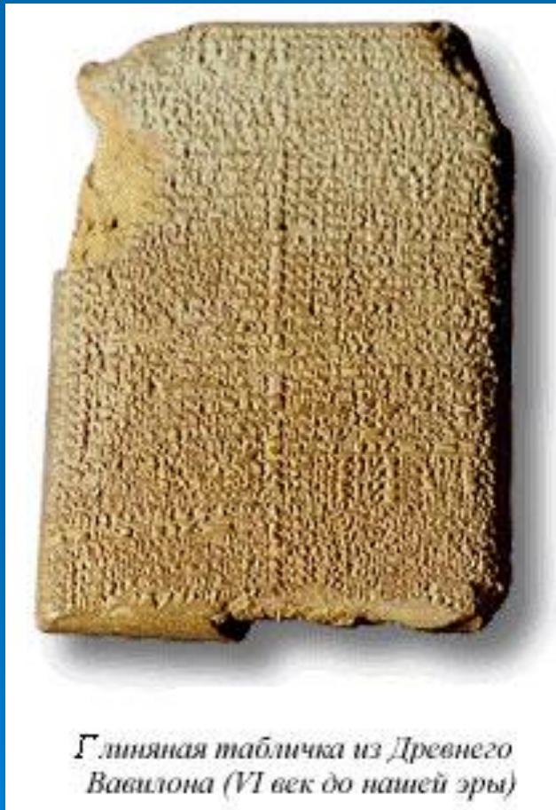
Глиняная табличка из Древнего Вавилона (VI век до нашей эры)

Прогрессии как частные виды последовательностей встречаются в древних египетских папирусах и в клинописных табличках вавилонян.