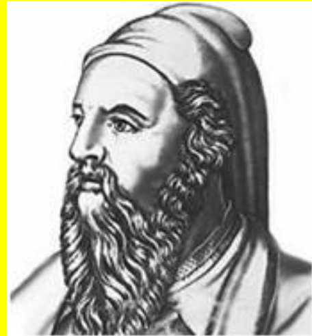
ПИФАГОР САМОССКИЙ (ок. 580 – ок. 500 г. до н.э.)

«Число — это закон и связь мира, сила, царящая над богами и смертными». «Сущность вещей есть число, которое вносит во все единство и гармонию». «Все есть число».