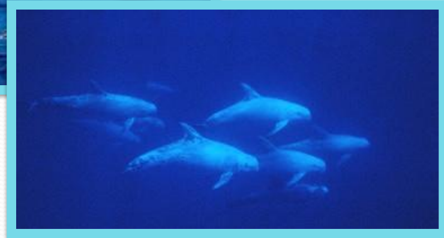
Серый дельфин (грампус)