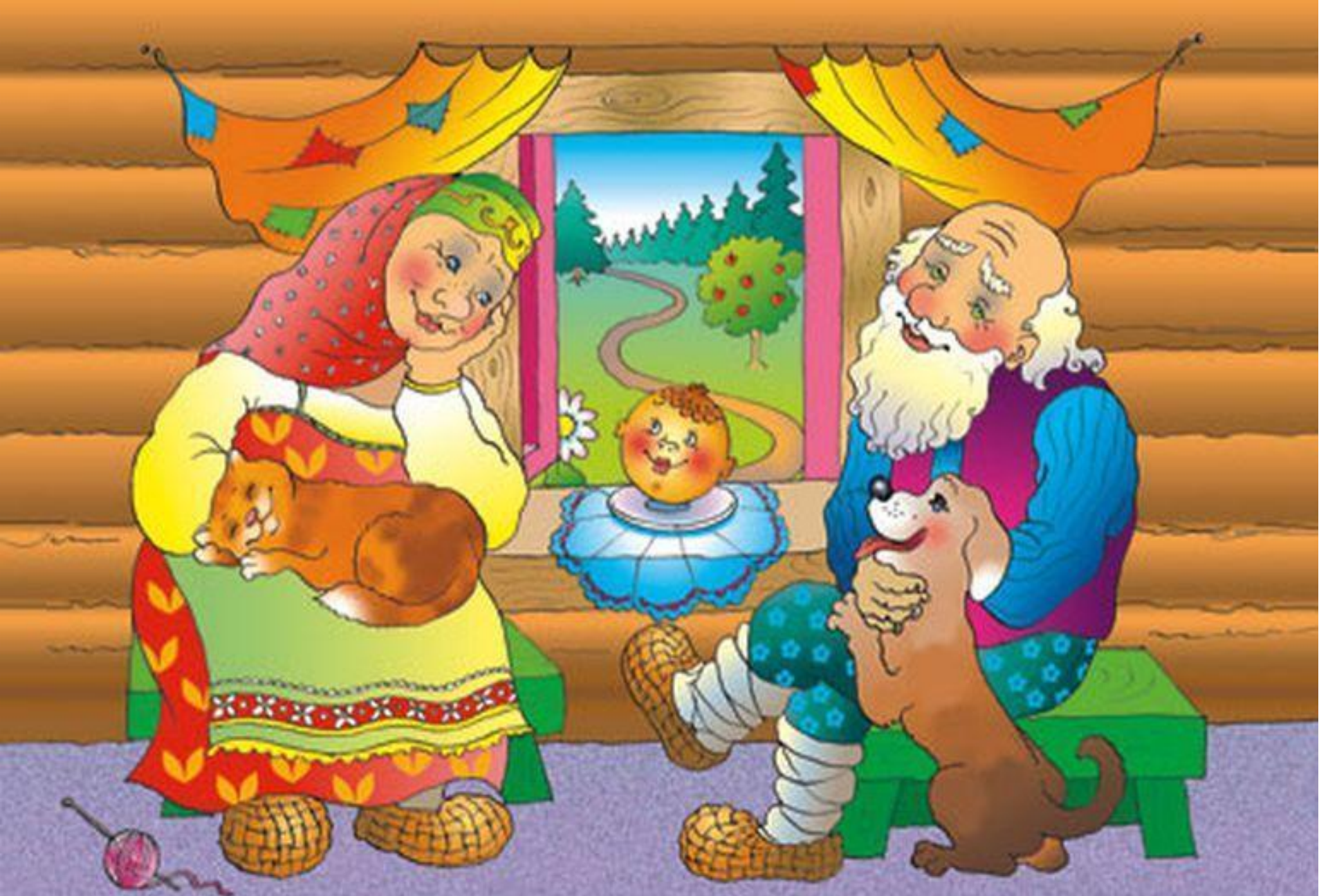
Дед, Баба и Коленок