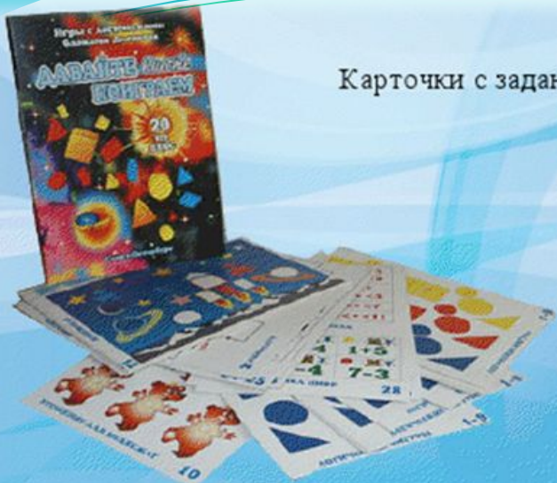
Альбомы для детей 5-8 лет