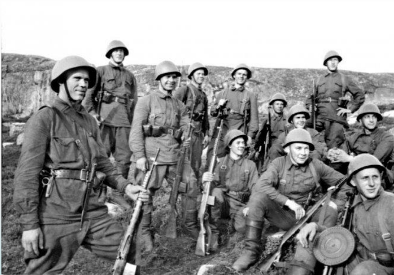
Группа разведчиков. Северо-Западный фронт, 1941 г, вторая мировая война.