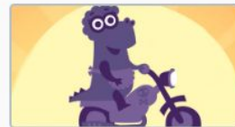
Стороны света 5 серия