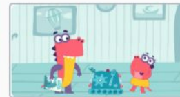
Генератор чуда 6 серия