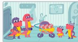
Кто что будет? 4 серия