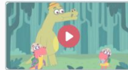
Люминарики 7 серия