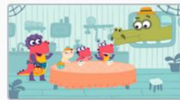
Ириски 2 серия