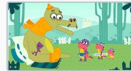
Секретное снадобье 3 серия