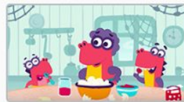
Юбилей 1 серия

Главные герои мультсериала Учи.ру — завтрак Гриша и его сестра Соня — в каждой серии сталкиваются с необычными задачами, но легко преодолевают их благодаря отличным знаниям из школьной программы. Приятного просмотра!