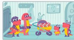
Кто что будет? 4 серия