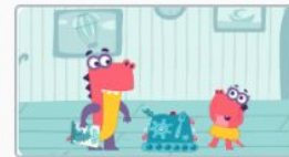
Генератор чуда 6 серия