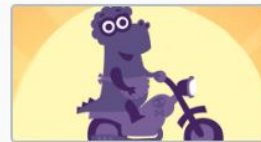
Стороны света 5 серия