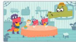
Ириски 2 серия