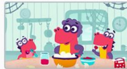
Юбилей 1 серия

Главные герои мультсериала Учи.ру — завтрак Гриша и его сестра Соня — в каждой серии сталкиваются с необычными задачами, но легко преодолевают их благодаря отличным знаниям из школьной программы. Приятного просмотра!