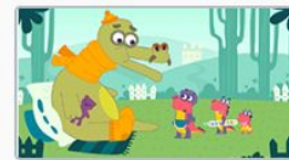
Секретное снадобье 3 серия