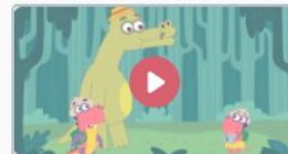
Люминарики 7 серия