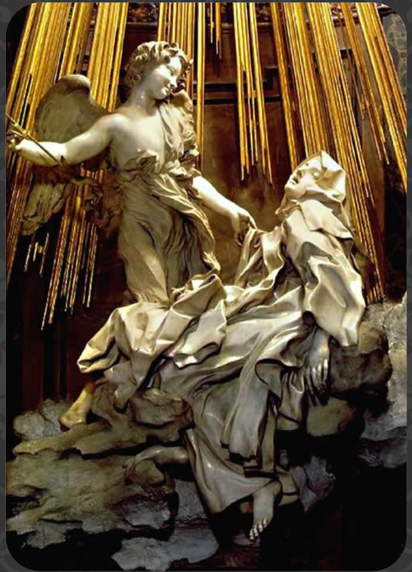
«Экстаз Св. Терезы» (1647—1652)