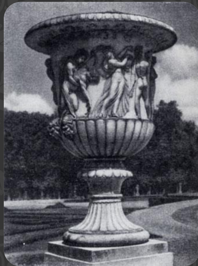
Антуан Кузевокс. Ваза Войны в парке Версаля.