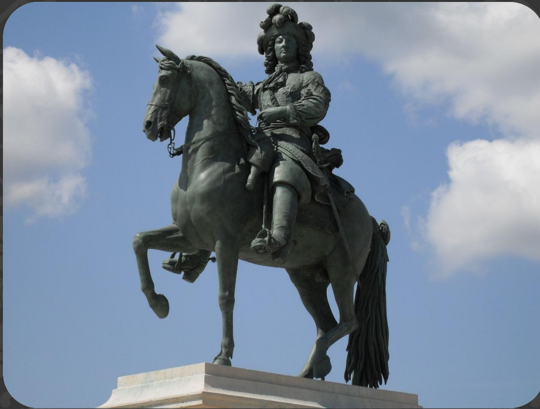
Статуя Людовика XIV в Версале.

Жак Сарразин, прошедший итальянскую школу, соединил в своем творчестве классицизм и барокко и опередил стиль Людовика XIV.