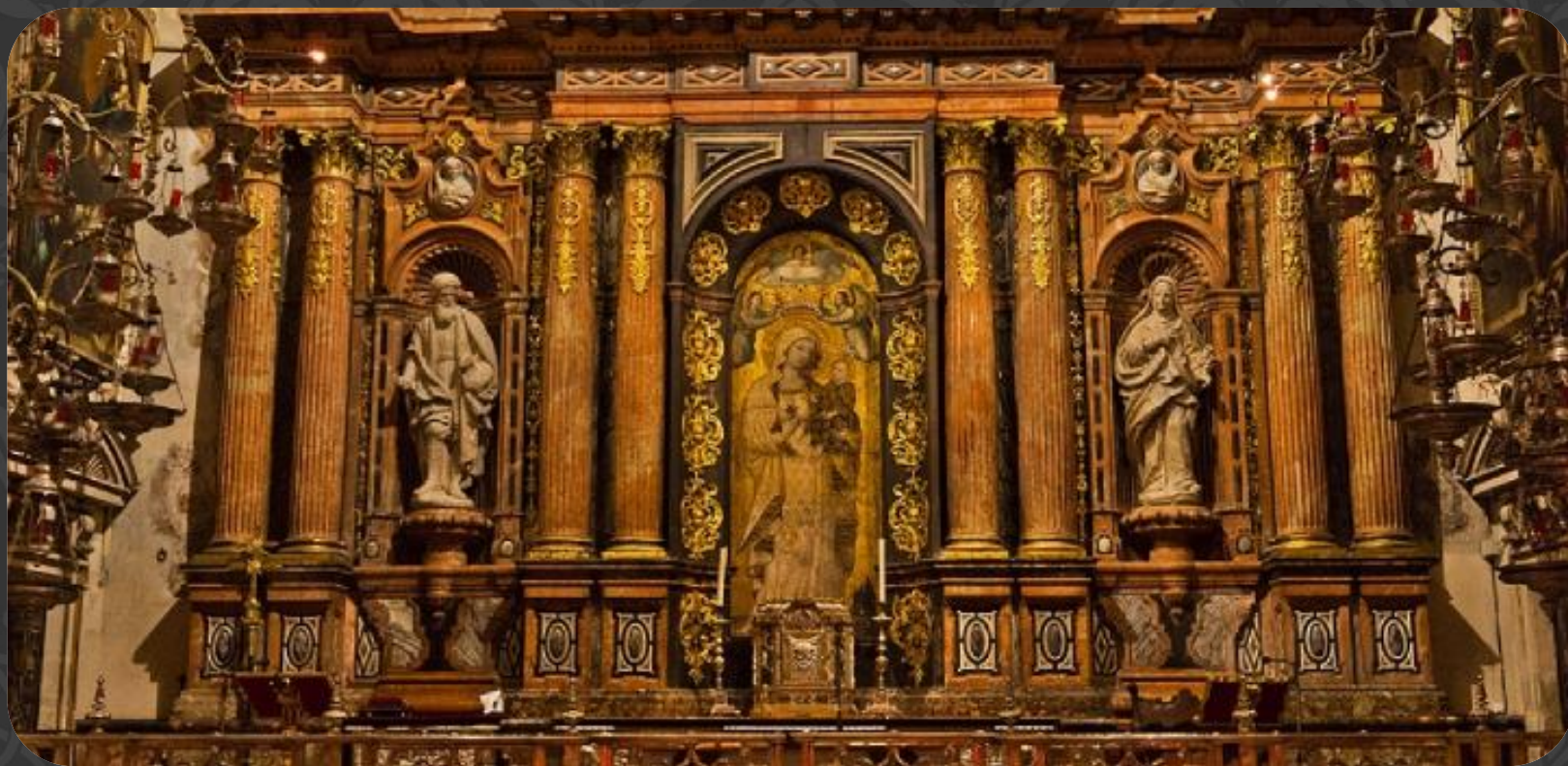
Педро Рольдано. оформление алтаря в соборе Севильи (1670—1672). Севилье

В Андалузии вся деятельность сосредоточилась в двух городах — Севилье и Гранаде, где скульпторы подчеркивали реализм священных образов, но усиливали их эмоциональность и духовность.