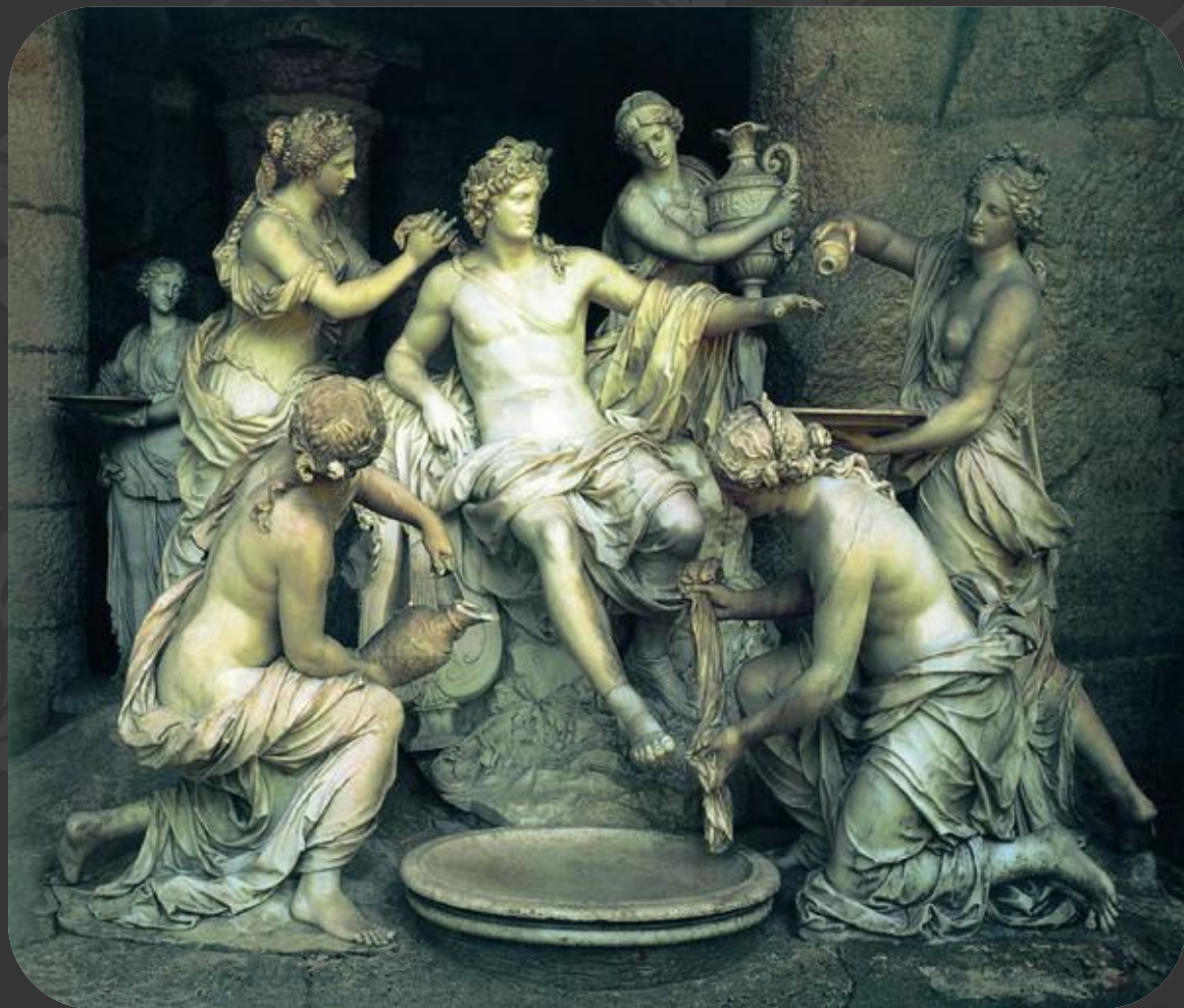
Франсуа Жирардон. Аполлон и Нимфы.

Первым новшеством, привнесенным скульптурой барокко, стал интерес к драматической сложности и многообразию мира. Главное внимание уделялось динамизму ансамбля благодаря воплощению сцен, изображавших определенный момент какого-то действия. Скульпторы стремились к включению зрителей в пространство скульптуры и усилению зрелищности сцены.