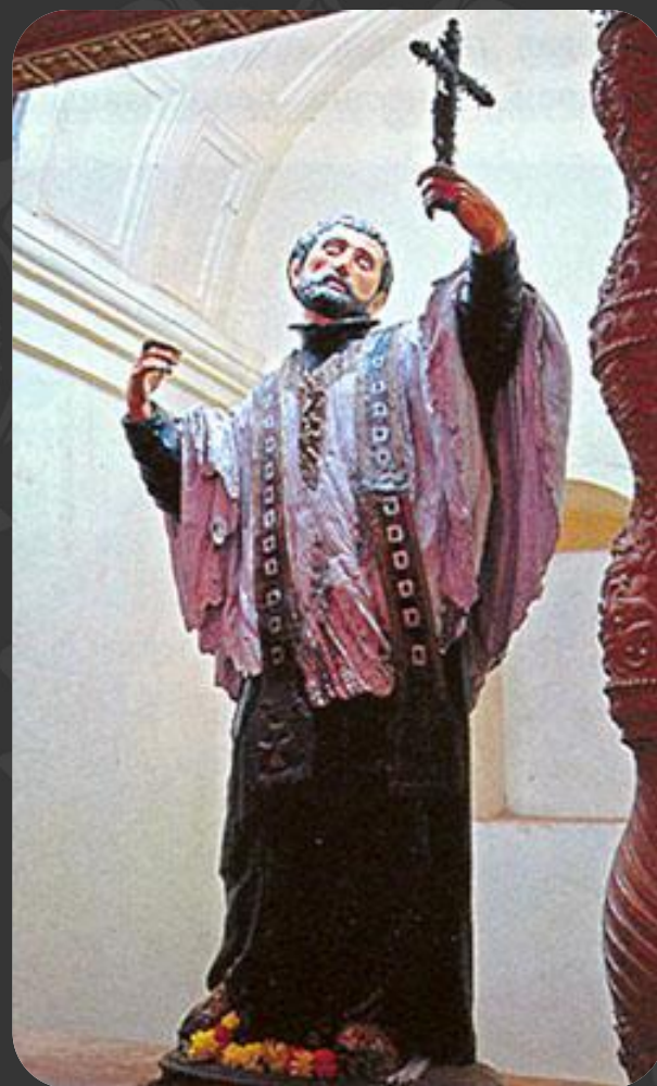
Мартинас Монтаньес. Св. Франциск Ксавьер (1619). Севилье.