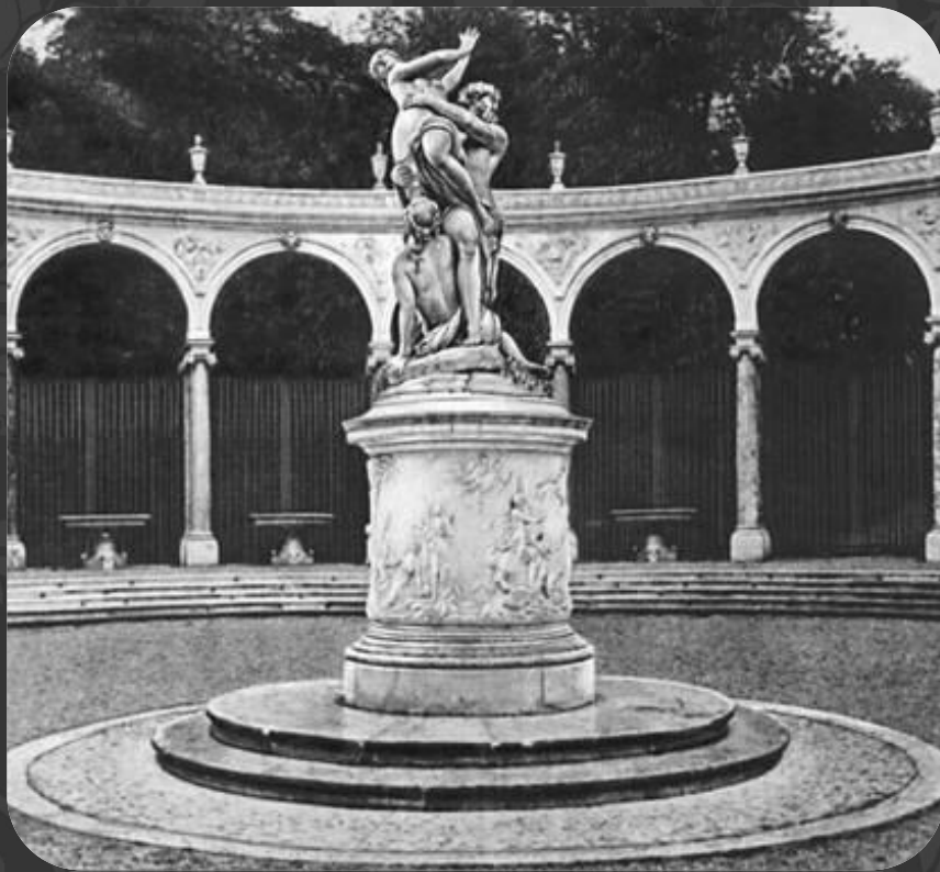
Франсуа Жирардон. Круглая колоннада. Версальский дворец.

Два скульптора, Франсуа Жирардон и Антуан Кузевокс, порвали с наследием Бернини. Оба работали на отделке Версальского дворца и были любимыми скульпторами короля.