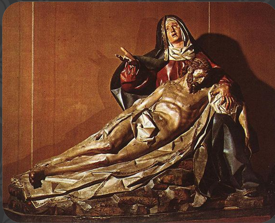
Григоріо Фернандес. Пьета (1617; Национальный музей скульптуры, Вальядолид).

В пластике установилась некоторая двойственность между реализмом и символикой: использовались сюжеты, взятые из реальной жизни, но предлагалось их прочтение в религиозном ключе. По форме скульптура была более близка к классицизму, а по содержанию — к барокко.