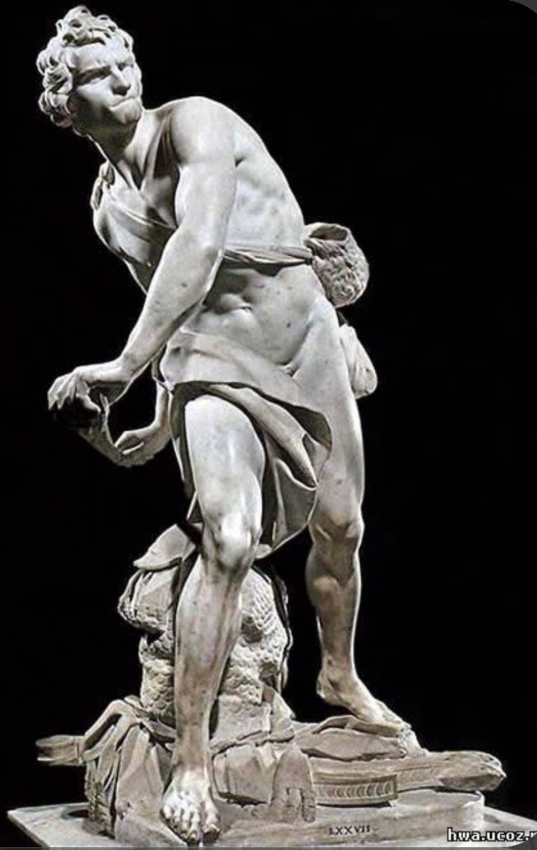
Лоренцо Бернини. Давид