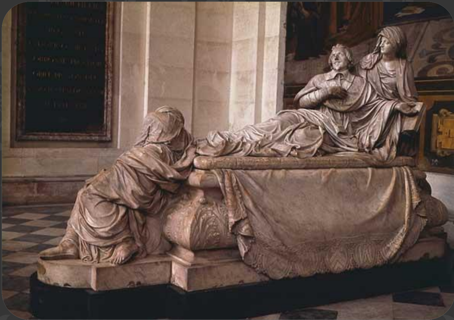
Франсуа Жирардон. Надгробие кардинала Ришелье (1675-1677).