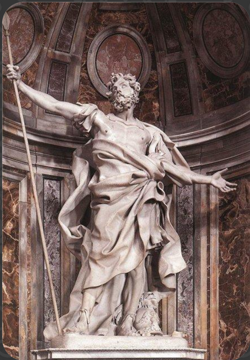
«Святой Лонгин» (1629—1638) в соборе Святого Петра