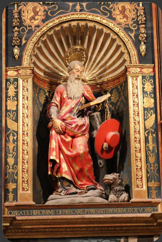
Мартинас Монтаньес. Св. Иероним (1600). Севилье.