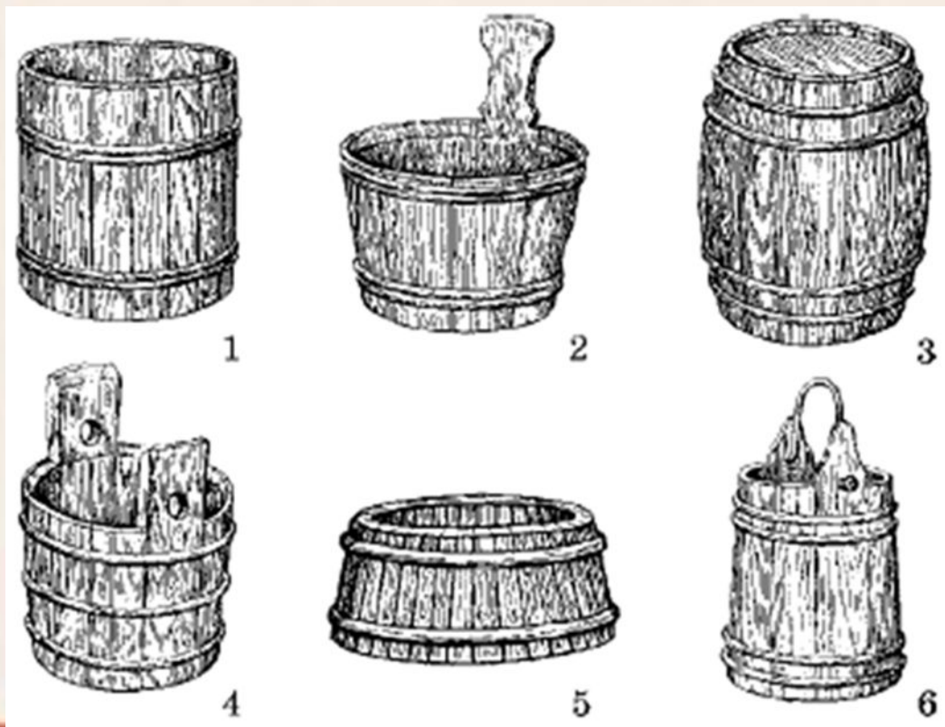
Бондарные изделия X–XIII вв.: 1 – кадка; 2 – шайка; 3 – бочка; 4 – ушат; 5 – лохань; 6 – ведро

Бочарная посуда (то есть, для жидких и сыпучих), отличалась разнообразием названий в зависимости от места производства (баклажка, баклуша, бочаты), от размера и объема – бадия, пудовка, сороковка), своего основного назначения (смоляная, солевая, винная, дегтярная). Готовая бочарная продукция подразделялась на ведра, кадки, чаны, бочонки и бочки