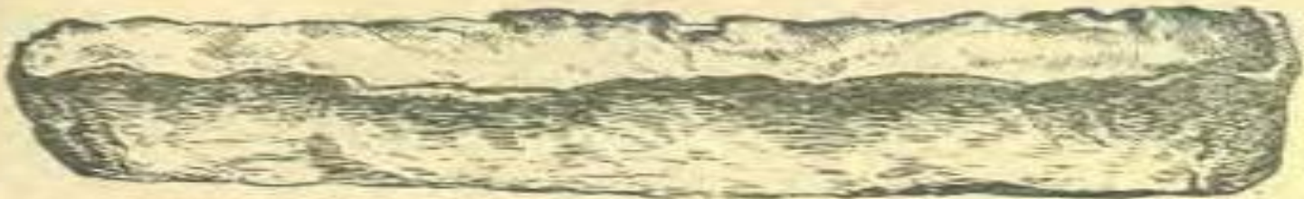
Рис. 27. Гривна новгородская лодкообразная в 18-золотников.

Наиболее древняя русская мера - гривна, или гривенка (позднее фунт). От латинского слова « pondus »-вес, гиря.