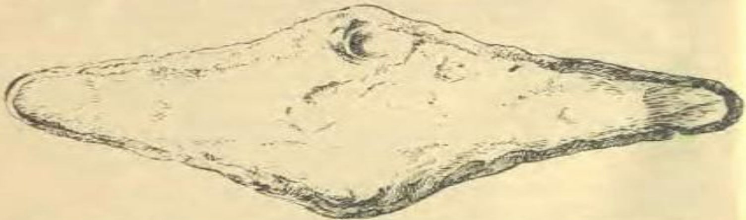
Рис. 26. Гривна черниговская, расплющенная от руки молотком.