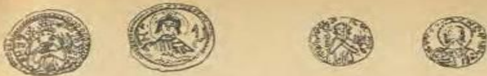
Рис. 20. Золотая монета — гиря («Златник») Владимира. XI век.

Гиря «Златник» Владимира – это золотая монета, весом 4 грамма. На лицевой стороне монеты – изображение великого князя в головном уборе с жезлом в руке и круговая надпись: «Владимир а се его злато» или «Владимир на столе». На оборотной стороне – поясное изображение с надписью «Иисус Христос». Серебряная гирька: на лицевой стороне – изображение почти такое же, как и на золотой монете и те же надписи. На оборотной стороне – окончание надписи с лицевой стороны и особый знак. Медная гирька князя Глеба (XII век), найденная в киевских пещерах при обвале стен. Вес этой гирьки 516,5 долей.