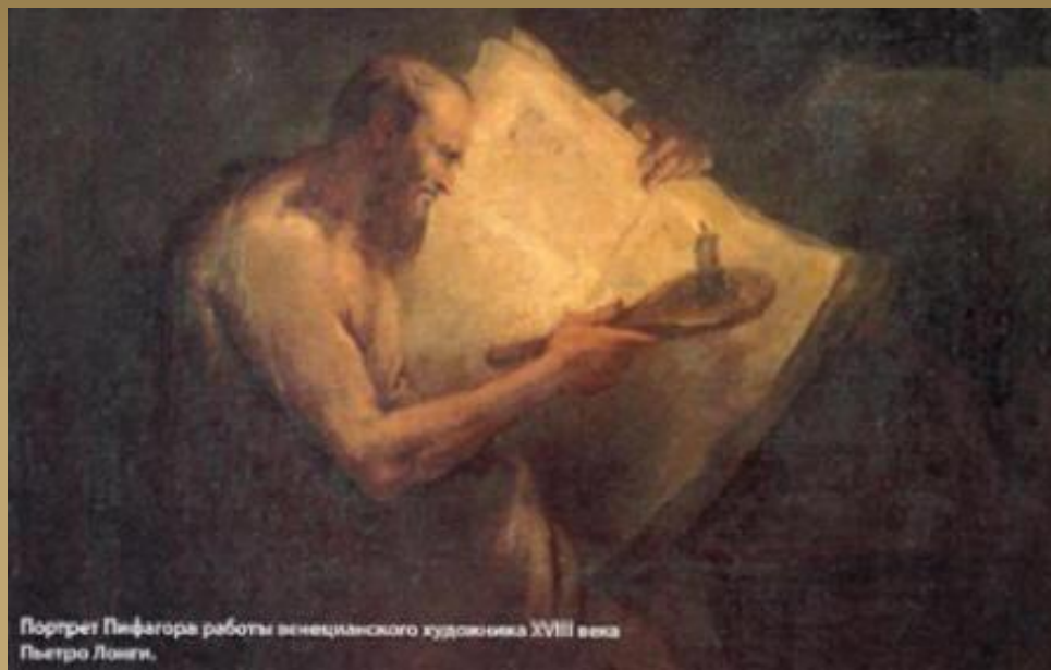
Портрет Пифагора работы венецианского художника XVIII века Пьетро Лонги.

Пифагор создал свою школу мудрости, положив в ее основу два искусства – музыку и математику . Он считал, что гармония чисел сродни гармонии звуков и что оба этих занятия упорядочивают хаотичность мышления и дополняют друг друга.