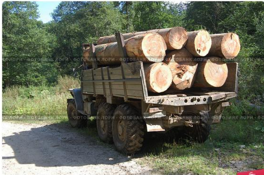
Машина, груженная бревнами