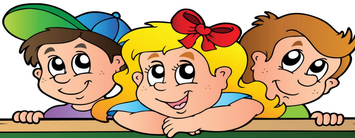
ТАБЛИЦА УМНОЖЕНИЯ И ДЕЛЕНИЯ