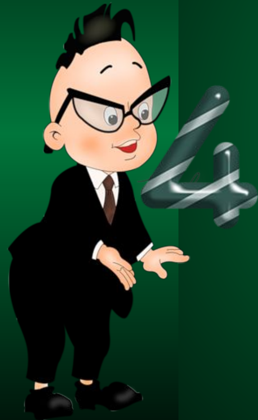
Таблица умножения Достойна уважения.