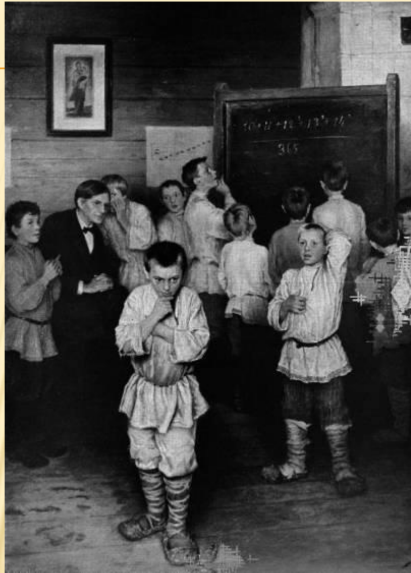
Н.Г. Богданов-Белинский «Устный счёт»