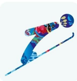
Прыжки на лыжах с трамплина