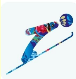
Прыжки на лыжах с трамплина