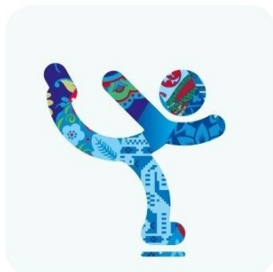
Фигурное катание на коньках