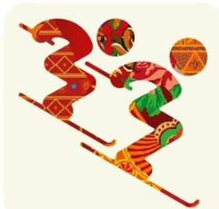
Фристайл - Ски-кросс