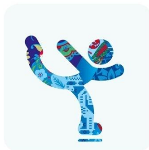
Фигурное катание на коньках