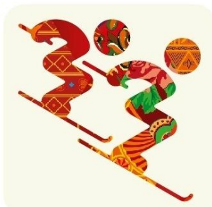
Фристайл - Ски-кросс