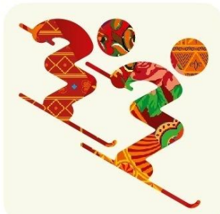
Фристайл - Ски-кросс